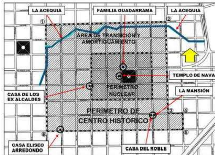
Ubicación de los inmuebles y la acequia, considerados dentro del régimen especial para su protección y conservación

Dentro del perímetro de la Zona Histórica, que señala el presenta Decreto, la acequia transita de oriente a poniente entre las calles de Morelos e Hidalgo y en el mismo sentido entra a la Zona Histórica, en la calle de Ramos Arizpe y la abandona en la calle Manuel Acuña, esta acequia por su importancia histórica y trascendencia en el desarrollo de la comunidad deberá preservarse y conservarse sin alterar su cauce original.